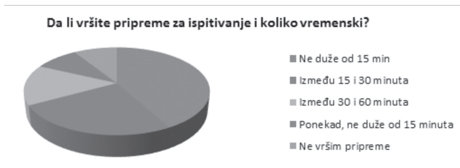
Grafikon 3. Vršenje priprema za ispitivanje

Nadalje, glede samog toka ispitivanja osumnjičenih osoba, smatrali smo značajnim postaviti pitanje o momentu prezentiranja dokaza. Tačnije, zanimalo nas je da li ispitanici osumnjičenoj osobi dokaze prezentiraju u ranijoj ili kasnijoj fazi ispitivanja. Navjeći dio ispitanika (67%) naveo je, da dokaze vezane za predmetno krivično djelo i osobe involvirane u njegovo izvršenje, prezentira u kasnijoj fazi ispitivanja. S druge strane, postotak od 24% ispitanika ističe, kako dokaze koje posjeduje prilikom ispitivanja prezentira u ranijoj fazi ispitivanja, dok 9% ispitanika navodi, da način i vrijeme prezentiranja dokaza osumnjičenoj osobi nisu bitni.