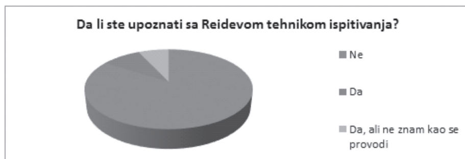
Grafikon 1. Prikaz odgovora o poznavanju Reidove tehnike ispitivanja

Na pitanje: „Šta prema vama podrazumijeva odabir vremena za vođenje ispitivanja osumnjičenih osoba i kakav je njegov značaj za obavljanje ove radnje“, 70 % ispitanika navodi da je odabir vremena i mjesta za ispitivanje, od ključnog značaja za otkrivanje počinioca, saučesnika, i rasvjetljavanje krivičnog djela. Dodatno, ispitanici ističu da je najbolje vrijeme za ispitivanje neposredno poslije izvršenja krivičnog djela, dok su još sjećanja svježija, te dok osumnjičeni nije pripremio svoju obranu. Interesantan je podatak da 9% ispitanika smatra da odabir vremena i mjesta za razgovor ne predstavljaju ništa važno i ne mogu imati odlučujući utjecaj na ishod ispitivanja.